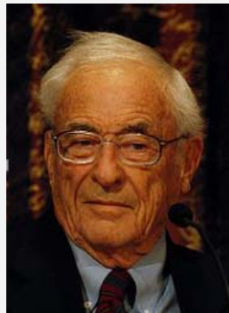
2009 年诺贝尔物理学奖获得者 威拉德·博伊尔