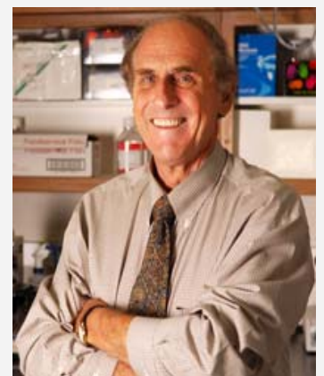
2011 年诺贝尔生理学或医学奖获得者 拉尔夫·斯坦曼