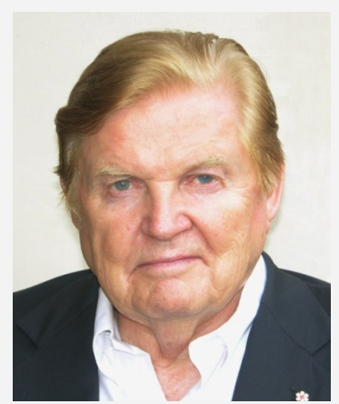
1999 年诺贝尔经济学奖获得者 “欧元之父”罗伯特·蒙代尔