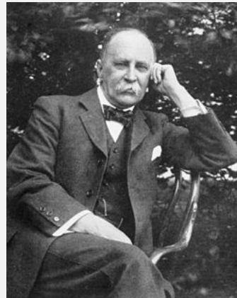
约翰霍普金斯大学医学院创始人之一 威廉 奥斯勒