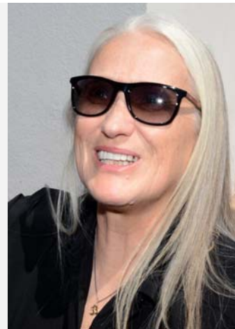
Jane Campion 奥斯卡最佳导演