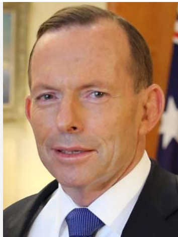
Tony Abbott 现任澳大利亚总理