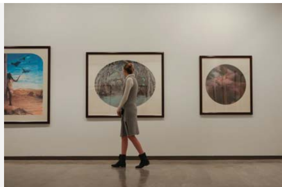
当代艺术博物馆（可选项）