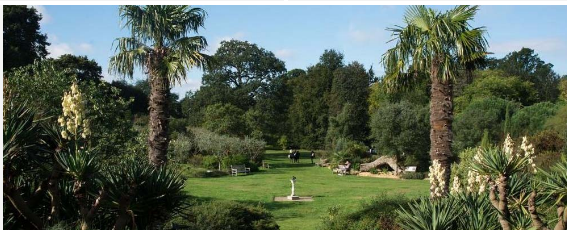
皇家植物园（可选项）