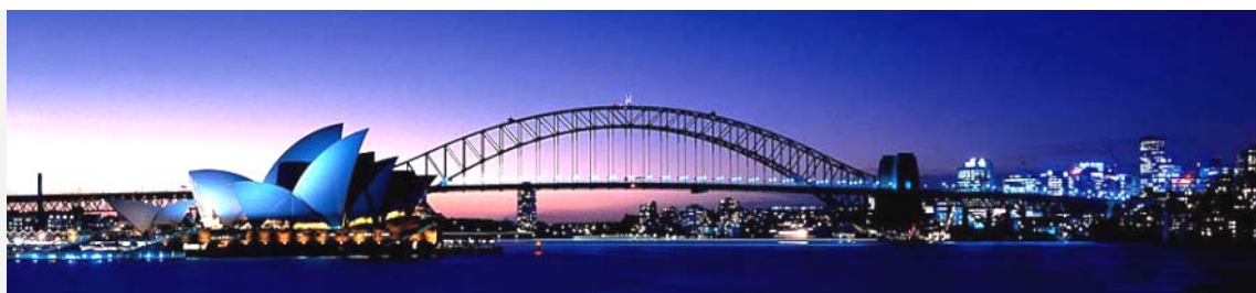
悉尼大桥和悉尼歌剧院