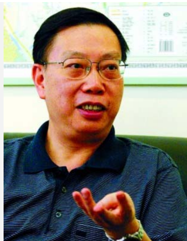
黄洁夫 中华人民共和国卫生部副部长